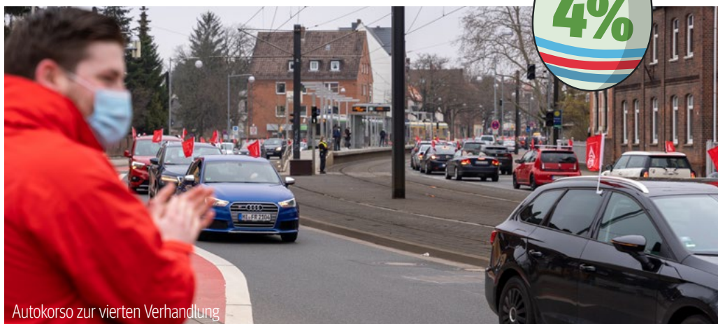
Autokorso zur vierten Verhandlung