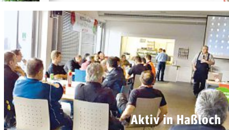
Aktiv in Haßloch