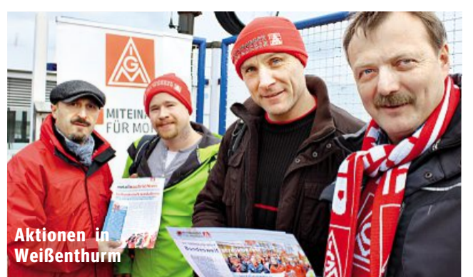
Aktionen in Weißenthurm