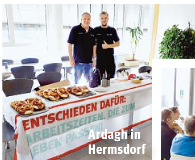
Ardagh in Hermsdorf

»Das Tarifergebnis ist komplex. Dennoch: es gibt gute Entgelterhöhungen und für alle die es brauchen eine Möglichkeit die Arbeitszeit vorübergehend abzusenken, ohne in die Teilzeitfalle zu rutschen.«