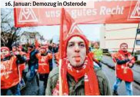
16. Januar: Demozug in Osterode