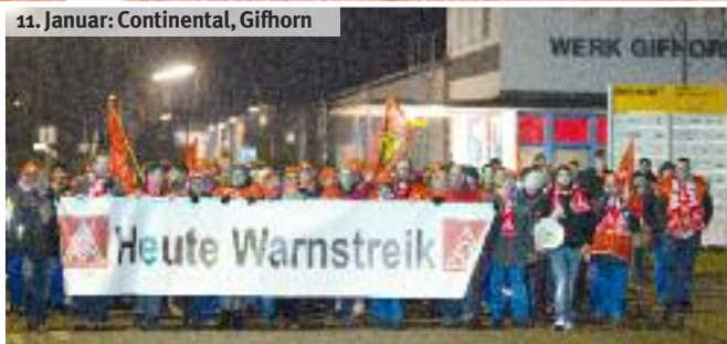
11. Januar: Continental, Gifhorn