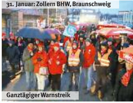
31. Januar: Zollern BHW, Braunschweig