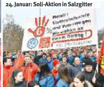
24. Januar: Soli-Aktion in Salzgitter