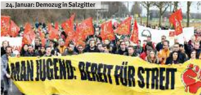
24. Januar: Demozug in Salzgitter