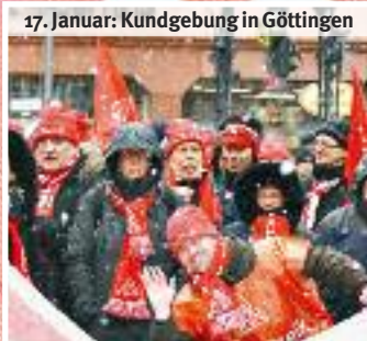
17. Januar: Kundgebung in Göttingen