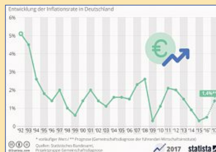
Experten erwarten mehr Inflation