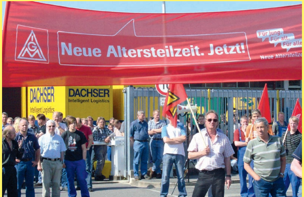
Hier die Auftakt-Aktion bei der Elster GmbH in Lotte-Wersen am 6. Juni: 300 Beschäftigte zogen vors Tor.

Rund 12 000 Beschäftigte aus 76 Betrieben gingen im Bezirk Niedersachsen und Sachsen-Anhalt von Mai bis Juni 2008 für die Altersteilzeit auf die Straße. Bundesweit waren es mehr als 360 000 Beschäftigte aus 1115 Betrieben. Aus dem Tarifgebiet Metallindustrie Osnabrück-Emsland waren folgende Betriebe dabei: Elster, Lear Corporation, Essex Nexans und NDI, Schomäcker und Diosna. Das war ein eindrucksvolles Votum für die Notwendigkeit, weiterhin vorzeitig aus dem Berufsleben ausscheiden zu können. Die zunehmende Leistungsverdichtung und die rasant steigenden Erkrankungen lassen es nicht zu, dass Menschen bis zum 67. Lebensjahr arbeiten. Das gilt für Ingenieure genauso wie für Beschäftigte in der Produktion.