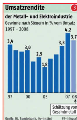
Der Branche gehts prima: Das hohe Niveau bleibt.

Und profitieren kaum vom Aufschwung: Die Löhne hinken den Gewinnen seit Jahren hinterher. Die hohe Inflationsrate belastet die Arbeitnehmer-Haushalte überdurchschnittlich. Die Verbraucherpreise werden im Jahr 2009 voraussichtlich um 2,5 Prozent steigen. Die Produktivität in der