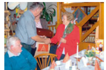
Jubilarsfeier in Hettstedt

cke schließen wir nicht von heute auf morgen. ■