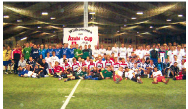
Gruppenbild mit zehn Teams: Der diesjährige Azubi-Cup war ein voller Erfolg.

gegeben. »Eisern Stahlwerk« besiegte den »1. SC Arbeiterdenkmal« mit 3:1. Den kompletten Spielverlauf sowie Fotos unter: www.osnabrueck.igmetall.de