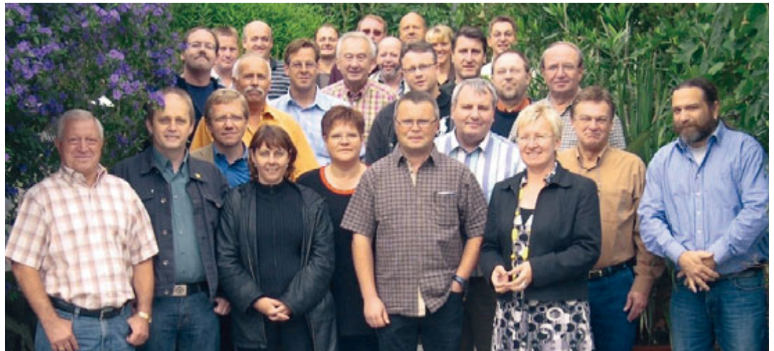
Gemeinsame Klausur der Ortsvorstände der IG Metall Alfeld, Hameln und Hildesheim: »Den Verwaltungsaufwand verkleinern und die Mitgliederbetreuung vergrößern.« Die Teams wollen gemeinsam agieren.

Dabei spielen zum Beispiel Überlegungen eine Rolle, dass die Anforderungen an die Betriebsbetreuung in den letzten zehn Jahren erheblich gestiegen sind. Scheibe: »Wir haben heute eine zunehmende Verbetrieblung der Tarifpolitik und eine verstärkte Auseinandersetzung um den Erhalt des Flächentarifs.« Hinzu kommen komplexe Einführungspro-