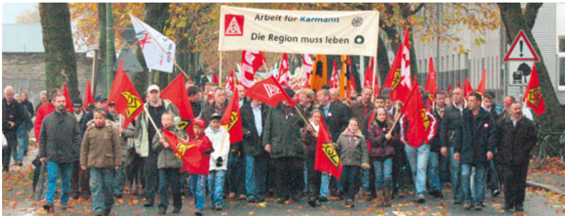
Soziale Katastrophe: Die Demonstration am 3. November mündete zu einer Kundgebung auf dem Osnabrücker Markt.