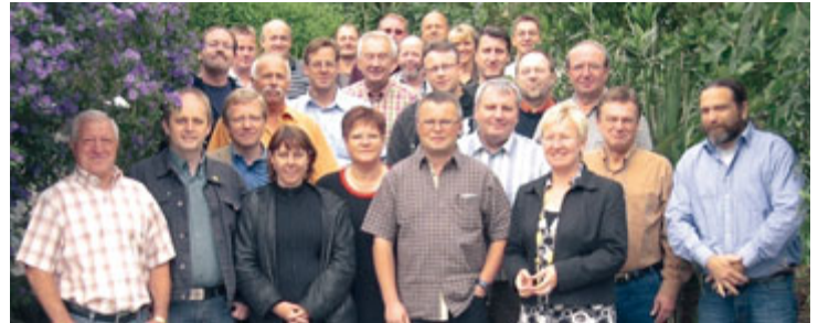
Ortsvorstände der IG Metall Alfeld, Hameln und Hildesheim: »Den Verwaltungsaufwand verkleinern und die Mitgliederbetreuung vergrößern.«

heißt, die IG Metall muss flexibel vor Ort sein, um die Mitglieder in den vielen Klein- und Mittelbetrieben sowie Arbeitslose und Rentner zu betreuen. Permanente Qualifizierungen sind notwendig, damit die Betreuung auf dem heutigen hohen Niveau fortgeführt werden kann.