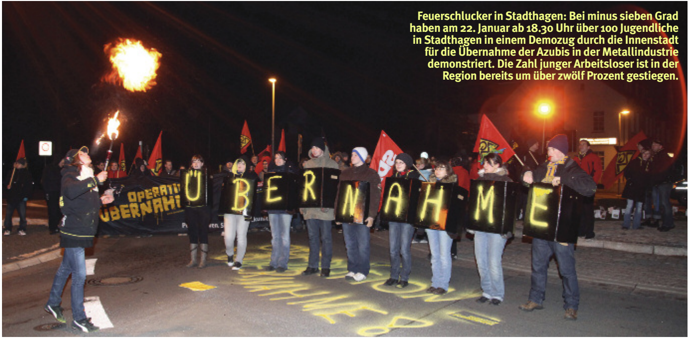
Feuerschlucker in Stadthagen: Bei minus sieben Grad haben am 22. Januar ab 18.30 Uhr über 100 Jugendliche in Stadthagen in einem Demozug durch die Innenstadt für die Übernahme der Azubis in der Metallindustrie demonstriert. Die Zahl junger Arbeitsloser ist in der Region bereits um über zwölf Prozent gestiegen.

Von den Arbeitgebern gab es nichts Konkretes zum IG Metall-Vorschlag: