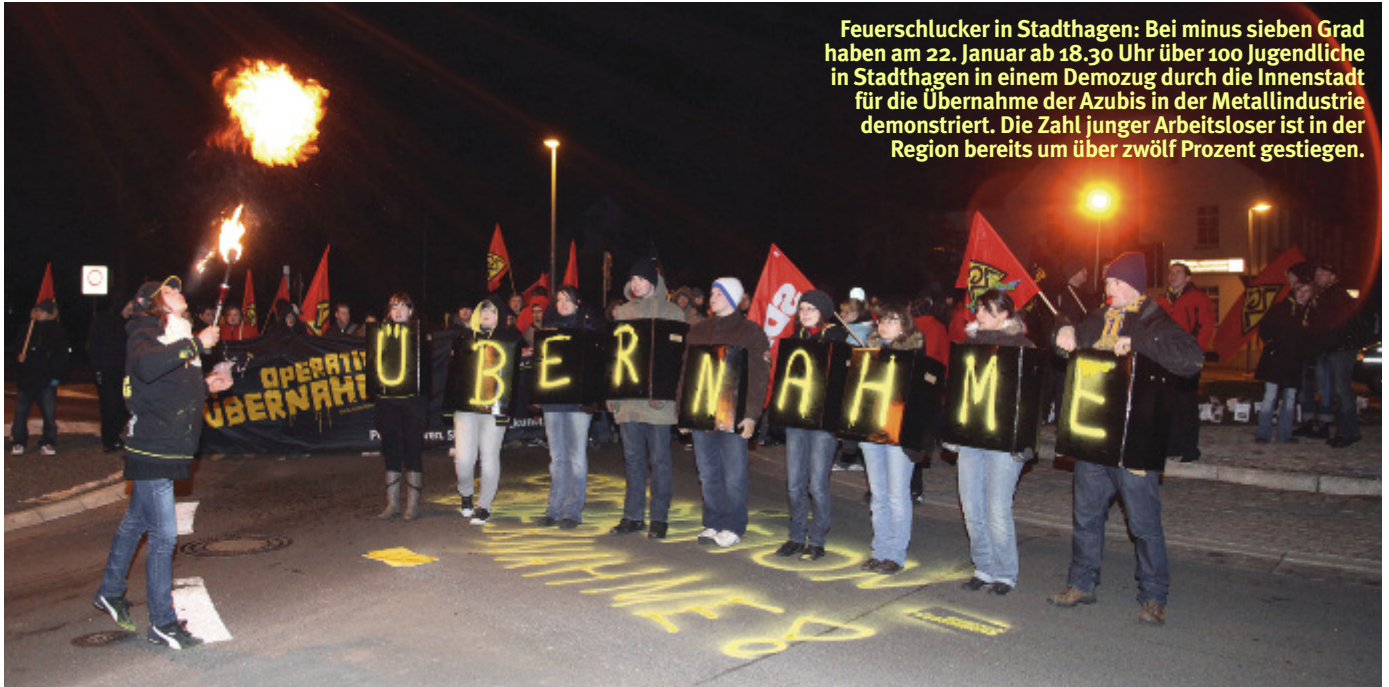
Feuerschlucker in Stadthagen: Bei minus sieben Grad haben am 22. Januar ab 18.30 Uhr über 100 Jugendliche in Stadthagen in einem Demozug durch die Innenstadt für die Übernahme der Azubis in der Metallindustrie demonstriert. Die Zahl junger Arbeitsloser ist in der Region bereits um über zwölf Prozent gestiegen.

Von den Arbeitgebern gab es nichts Konkretes zum IG Metall-Vorschlag: