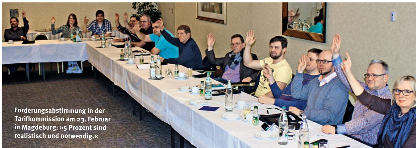
Forderungsabstimmung in der Tarifkommission am 23. Februar in Magdeburg: »5 Prozent sind realistisch und notwendig.«

Information für die Beschäftigten der Metall- und Elektroindustrie Sachsen-Anhalt