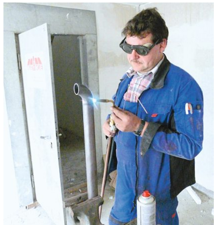
Heizungsmonteur vor Ort: Optimistische Konjunkturaussichten