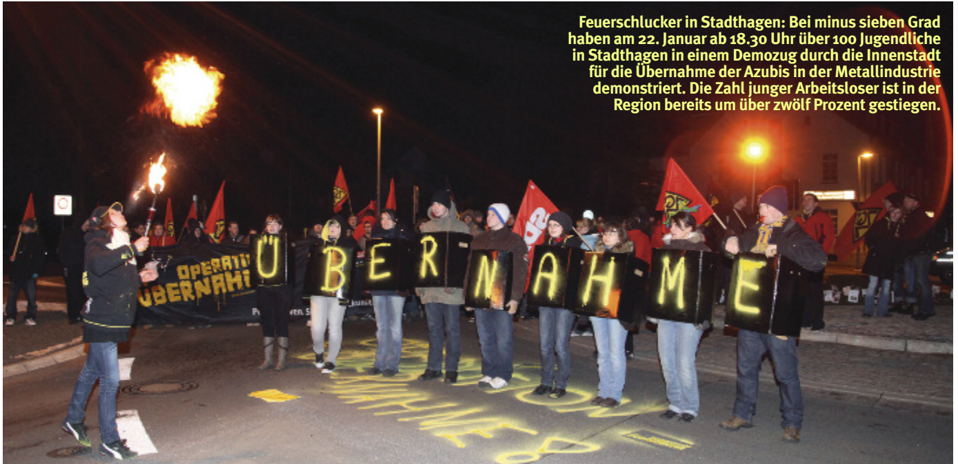
Feuerschlucker in Stadthagen: Bei minus sieben Grad haben am 22. Januar ab 18.30 Uhr über 100 Jugendliche in Stadthagen in einem Demozug durch die Innenstadt für die Übernahme der Azubis in der Metallindustrie demonstriert. Die Zahl junger Arbeitsloser ist in der Region bereits um über zwölf Prozent gestiegen.

Von den Arbeitgebern gab es nichts Konkretes zum IG Metall-Vorschlag: