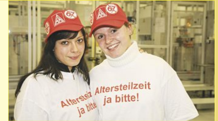
Demo für die Altersteilzeit: Die Beschäftigungsbrücke hat sich bewährt: Ältere gehen früher, die Stelle wird durch auslernende Azubis wieder besetzt. Hier ein Bild vom Frühjahr 2007 im VW-Werk in Braunschweig.