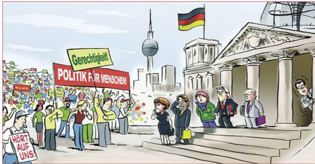
Die IG Metall konfrontiert die Politik mit den Forderungen aus der großen Arbeitnehmer-Befragung vom Frühjahr

5. September dann um 10 Uhr die Jugendkundgebung an der Alten Oper, dann ab 13 Uhr die Kundgebung in der Arena mit Berthold Huber und Detlef Wetzell. Die IG Metall stellt Busse und Züge zur Verfügung.