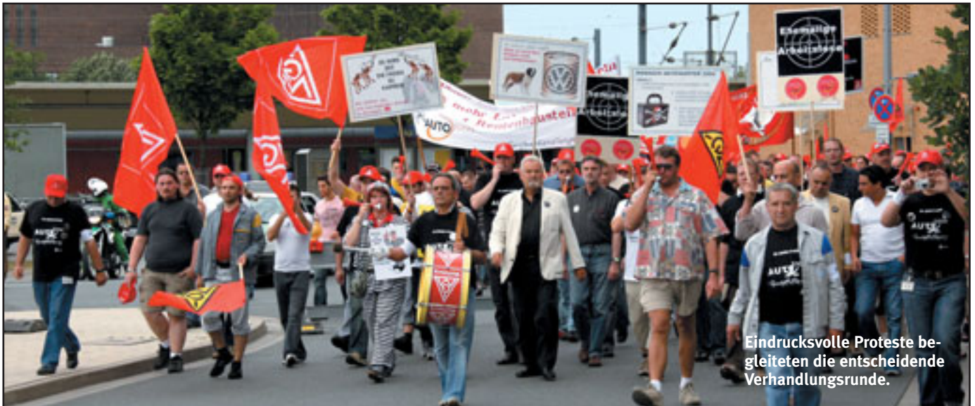
Eindrucksvolle Proteste begleiteten die entscheidende Verhandlungsrunde.